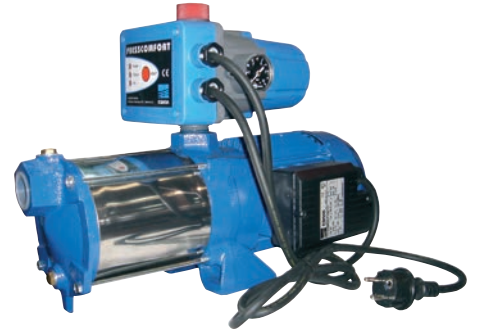
TABLA DE SELECCIÓN RÁPIDA (G.P. "COMPACT")